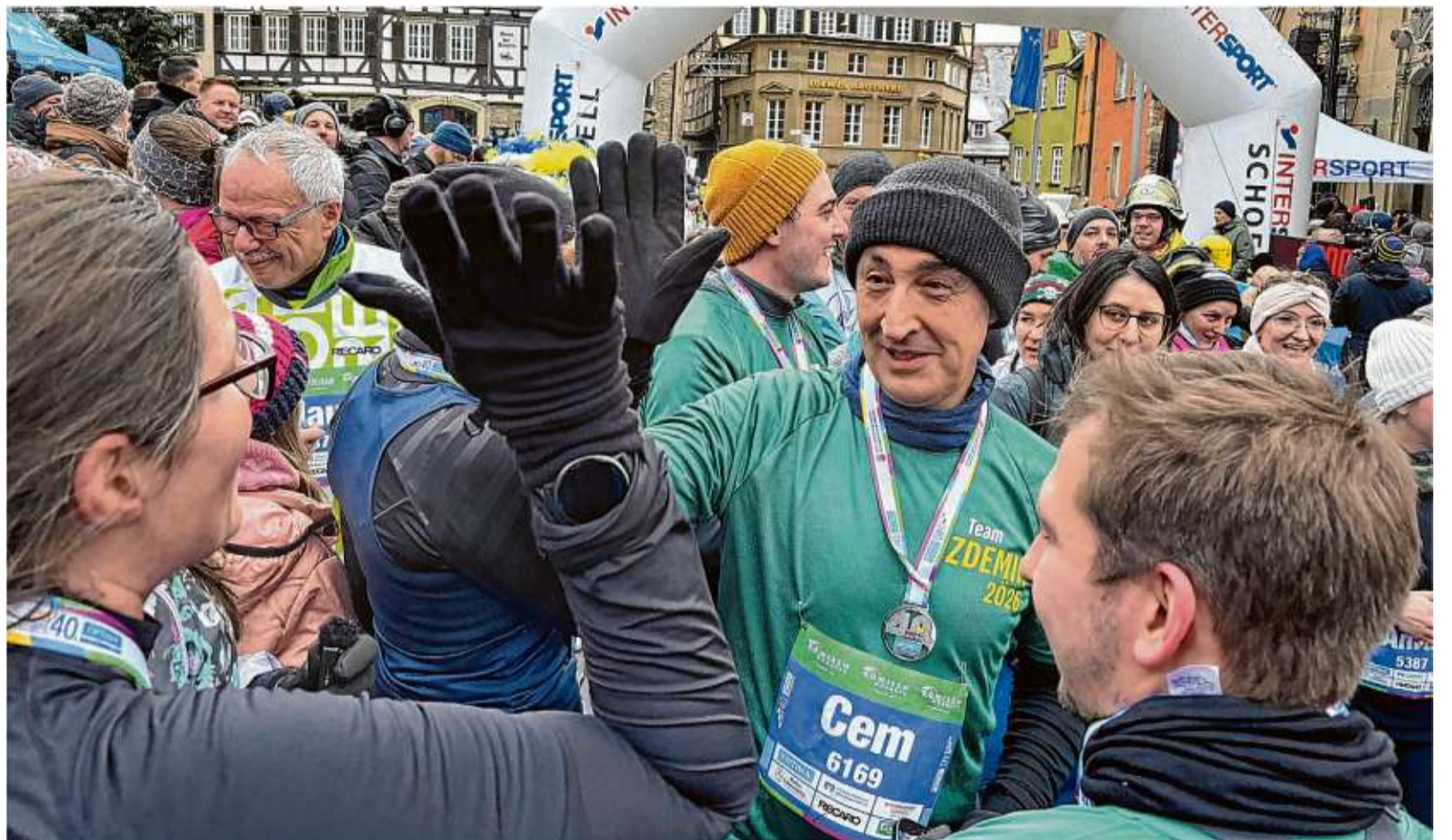
High Five nach dem Fünf-Kilometer-Lauf: Grünen-Spitzenpolitiker Cem Özdemir zeigt sich beim Dreikönigslauf in Schwäbisch Hall bürgerlich. Bei der neuesten SPIEGEL-Politikertreppe liegt er hinter Boris Pistorius und Frank-Walter Steinmeier auf Platz drei der beliebtesten Politiker auf Bundesebene. Die Umfragewerte seiner Partei sind allerdings im Moment nicht besonders aussichtsreich.