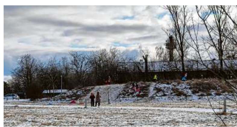
Das war lange nicht mehr möglich: Schlittenfahren in den Weihnachtsferien. Hier im Wohngebiet Breiteich auf dem Teurershof. Das Foto hat unsere Leserin Karin Schulz eingeschickt. Foto: privat