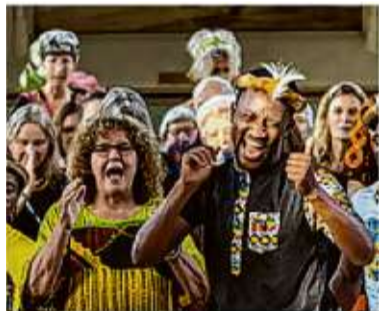
Der Chor Mocosole bei einem seiner Auftritte.